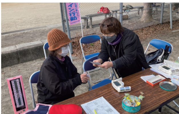
バレンタインカードで医療生協をアピール!

動をもっと多くの人に知って欲しい」と街頭で地域の人たちに呼びかけをすすめました。バレンタインカードには、医療福祉生協の活動・事業案内や、日本国憲法第25条、第9条、第13条に沿った誰もが健康で安心してくらせる社会、平和な社会をめざしたアピール文を掲載しています。私たちの理念は「健康をつくる。平和をつくる。いのち輝く社会をつくる。」です。理念の実現へ向け地域社会・多くの団体と連携し、健康で安心してくらせる社会をめざし取り組みをすすめてみましょう。