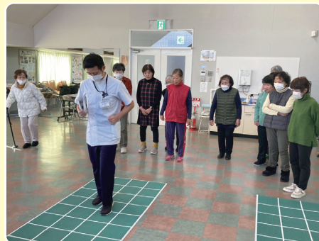
右に左にステップを踏んでいきましょう!

体験会後の茶話会では「次回以降、自分たちでもできるように覚えていきたい」「簡単そうで難しかった。でも、続けると楽しい」といった声がありました。