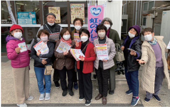
各地域でバレンタイン行動を行いました

2025年3月号 鹿児島医療生活協同組合 鹿児島市谷山中央5丁目12番3号 電話 (099) 268-8955 FAX (099) 269-7199 編集 機関紙編集委員会 発行責任者 専務理事 福 峯 清 行