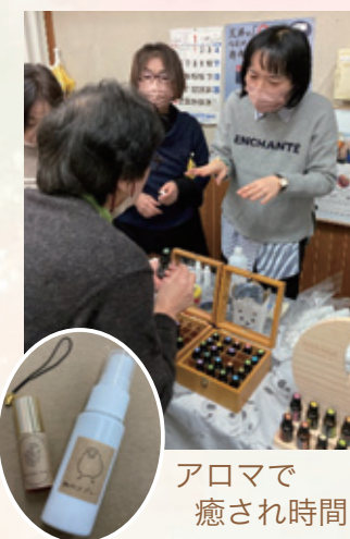
アロマで癒され時間

皇徳寺支部にて合同班会が開催され、19名の参加がありました。講師をお招きしてのアロマ班会。アロマについての学習のあとは、実際に香りスプレーやロールオンづくりに挑戦！先生にアドバイスをいただきながら、自分好みの香りスプレーを作りました。久々の合同班会でしたが、香りに癒され、楽しいひとときを過ごすことができました。参加者から「またこんな班会したいね」「次は何の班会にする？」などと嬉しい声が聞こえたので、次の班会開催へ向けてまた計画していきたいです！