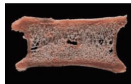
正常な背骨の断面図