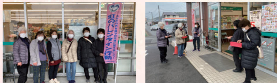
寒いなか、元気よくアピール！

コープ伊集院店にて郡山松元支部・日置支部合同で虹のバレンタイン行動を開催しました。参加した運営委員全員で、チョコと一緒にバレンタインカードを手渡しし、医療生協の活動の紹介を行いました。参加した運営委員さんからは「医療生協について知ってもらうことは大事だと思う」「足を止めてくださる方がたくさんいてうれしかった」などの感想がありました。久しぶりの統一行動ということもあり、みなさん積極的に取り組みました。(日置支部 東洋子)