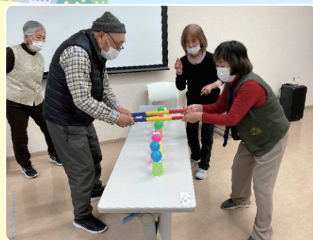
力を合わせて! ボールをよいしょ! (紙コップ色合わせゲーム)

参加者からは「久しぶりに参加しました。頭の体操になりました」「本日も学んだ脳トレなどを自分の班会でも取り入れたい」などの感想がありました。