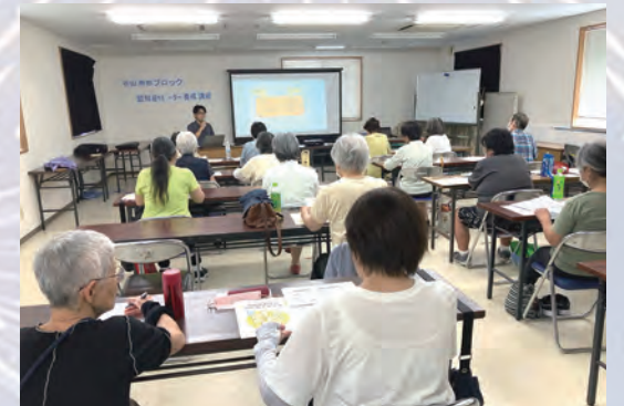
声のかけ方って大切なのねー!

谷山南部ブロック主催で認知症サポーター養成講座を開催しました。クイズを交えながらのお話は、楽しく認知症について学ぶことができました。認知症の方に間違った接し方をすると症状が悪化することもあるというお話もあり、認知症の方への対応は難しいなと思っていましたが、接し方の「3ない」①驚かせない ②急がせない ③自尊心を傷つけない、に気をつけながら落ち着いて声かけをしていこうと思います。