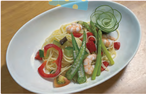
※ピーラーで薄くスライスしたキュウリをくるくる巻くとかわいいお花に (分量外)