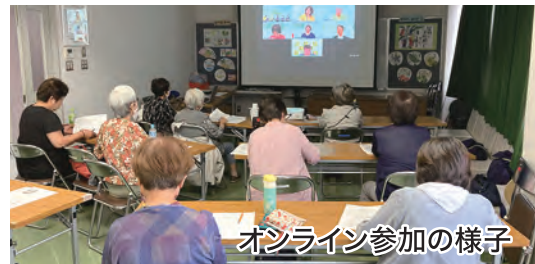
オンライン参加の様子

“鹿児島よかよか体操”と工作や脳トレ、月に1回のギターなどの伴奏を交えた“うたごえ広場”を開催し、楽しみながらフレイル予防に取り組んでいます。その他、行政とのつながりで保健センターや理学療法士協会からの定期的な指導も取り入れています。