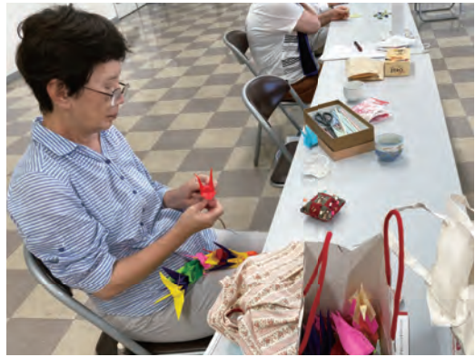
自宅で作った折り鶴を持ち寄りました

2月にはウクライナで戦闘が激化し、子どもが死傷し続けているとの声明も出されています。約2年前の戦争激化以来、ウクライナ全土で1,820人以上の子どもが死傷しています。国