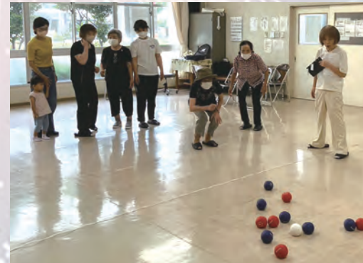
最後の一球! 狙いを定めて……。

「皆で楽しめるゲームがしたいね」との話をきっかけに、3人でポッチャの班ができました。初めての班会には荒田支部の運営委員さんも数名参加してくださり、ポッチャが始まりました。赤と青のボールを投げ合い一喜一憂して、あっという間の1時間でした。「初めてのゲームで楽しかった! 次回も頑張ります」などの声が聞かれました。毎月第1木曜日を定例日に八幡福祉館で開催します。これから楽しい班会を続けていきたいと思しますので、ご興味のある方はお気軽にお問い合わせ下さい。