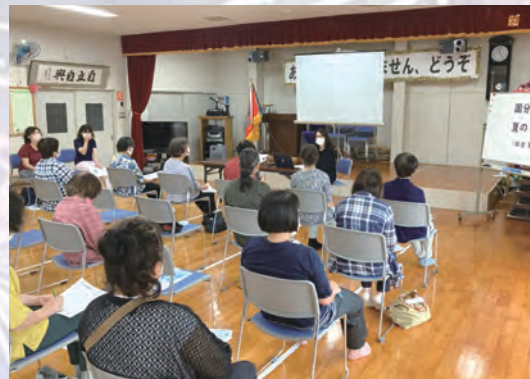
みなさん真剣に話を聞いていました

夏の班長会で国分生協病院の放射線技師による「CT、MRIの違いについて」の学習講演がありました。CTは放射線を用いる検査で、MRIは磁力を使って画像化していることなど教えていただきました。被ばくのことや、磁力のため金属製のものの持ち込みに気をつけなさいといけなさいなど、検査にあたっての注意点も知ることができました。また、調べる臓器ごとに使い分けたり、MRIががんの検査とPET検査と同様に使われていることなど、病気をどのように調べているかがとても勉強になりました。