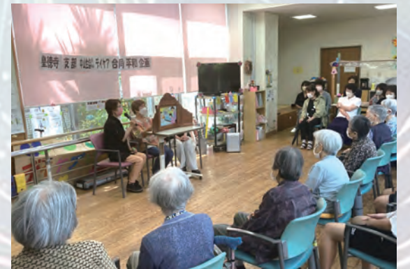
思わず感情が込み上げてくる場面も……

皇徳寺支部では、中山生協クリニックデイケアに運営委員がボランティアで伺い、夏の平和企画を開催しました。運営委員による紙芝居のあと、デイケア利用者さんの貴重な戦争体験談を聞きました。参加者からは「戦争の恐ろしさ、平和の尊さを次の世代に語り継いでいくことが大切」などの感想があり、平和について改めて考える良い機会となりました。当日は職場体験に来ていた中学生4名の参加もあり「今普通に生活できているのは当たり前じゃないんだと思った」と、戦争のときの様子を知って平和のありがたみを感じているようでした。