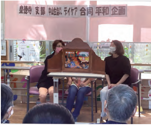
紙芝居『原爆の子さだ子の願い』を実演しました

2024年8月号 鹿児島医療生活協同組合 鹿児島市谷山中央5丁目12番3号 電話 (099) 268-8955 FAX (099) 269-7199 編集 機関紙編集委員会 発行責任者 専務理事 福 峯 清 行