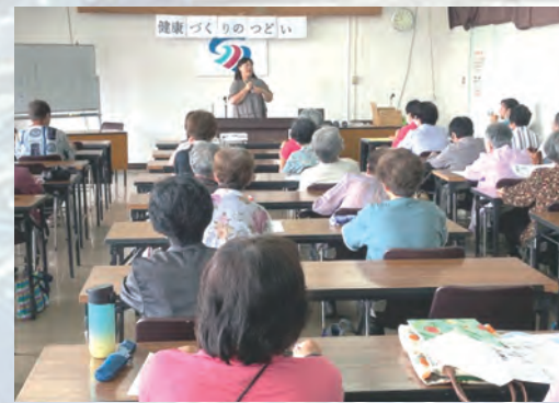
生活習慣を見直すきっかけになりました

南さつま支部では川辺生協クリニックの看護師を講師に「知って防ごう糖尿病」をテーマに班長会を開催しました。「鹿児島県民は糖尿病の人が多い?」といったクイズの後に、病気の原因や合併症、病気になるのを防ぐための食事の工夫についてのお話がありました。参加者からは「食事のことや治療にかかる医療費まで聞けてよかった」「看護師さんの体験事例の話に聞き入った」と大変好評で、あらためて日々の食事や運動習慣の大切さを感じる班長会となりました。