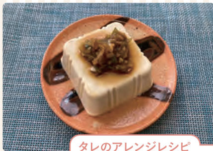
タレのアレンジレシピ ねぎ生姜だれの豆腐のせ