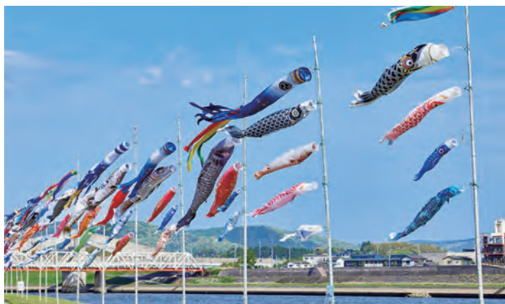
河川敷の鯉のぼり (薩摩川内市)

鹿児島医療生活協同組合 鹿児島市谷山中央5丁目12番3号 電話 (099) 268-8955 FAX (099) 269-7199 編集 機関紙編集委員会 発行責任者 専務理事 福 峯 清 行